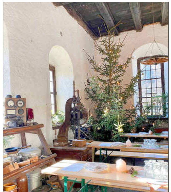
Unser weihnachtlich geschmücktes Pochwerk