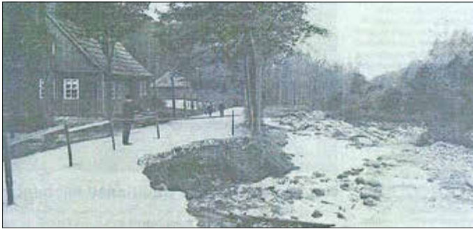
Wilzschhaus /Blechhammer

Auf der Strecke der Schmalspurbahn Carlsfeld-Wilzschhaus ruhte der Bahnbetrieb. Die Wilzsch hatte den Bahndamm an einigen Stellen unterspült.