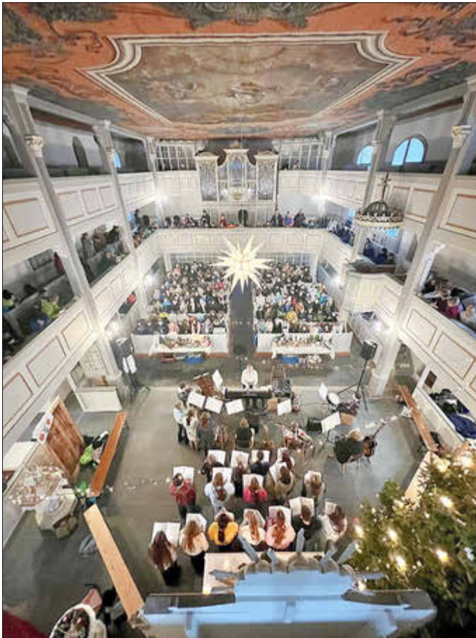
Weihnachtliches Abschlussprogramm in der Kirche Breitenbrunn

Das neue Jahr startet sportlich. In der Woche vom 27.01. – 30.01.25 soll unsere Wintersportwoche der Klassen 7 durchgeführt werden. Sollte der Winter es zulassen steht auch noch der Wintersporttag in Tellerhäuser an.