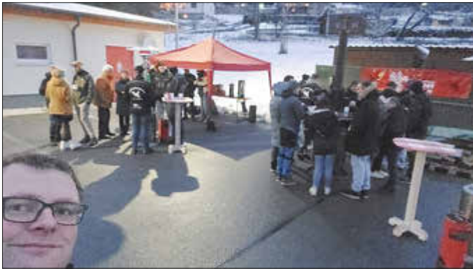
interner Weihnachtsmarkt hinter der Feuerwehr