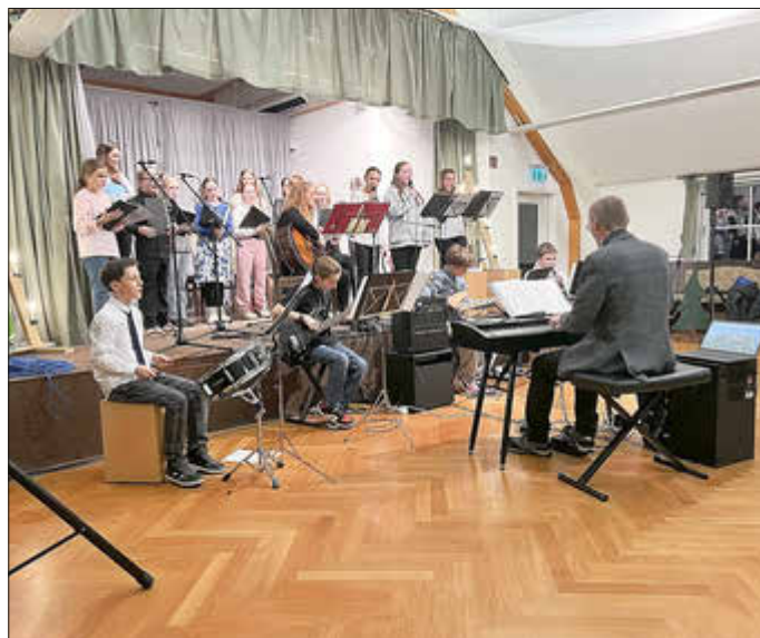
Weihnachtskonzert im Haus des Gastes

Besonders große Leistungen hat unser Schulchor und unsere Schulband in der Weihnachtszeit geleistet. So luden die Interpreten einmal zum Weihnachtskonzert am 12. Dezember in das Haus des Gastes ein, bei dem sie vor Eltern, Gästen der Gemeinde und Lehrern mit schönen Liedern zum Mitsingen und Geschichten weihnachtliche Stimmung verbreiteten.