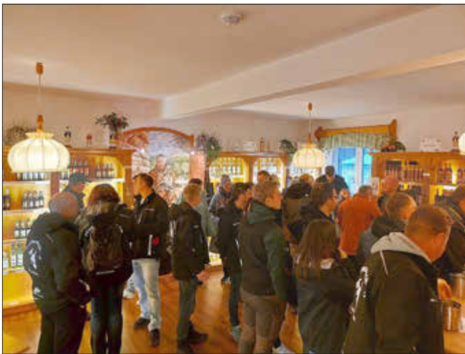
Verkostung in der Brennerei Lautergold