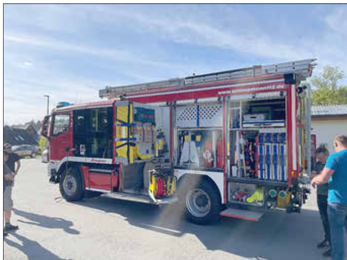
Vorführung HLF 20 Schlingmann am 31.05.2023

Freiwillige Feuerwehr Breitenbrunn Ortsfeuerwehr Breitenbrunn - Ortswehrleitung -