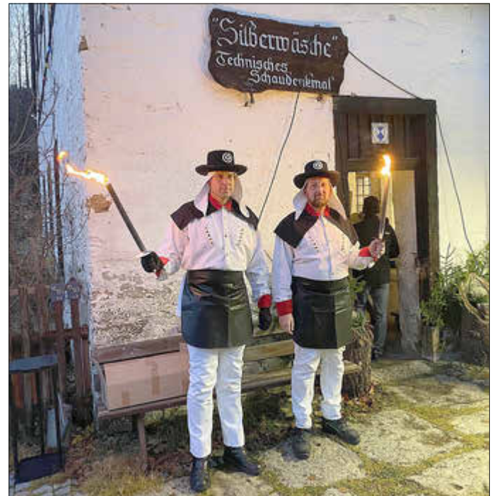
Berg- und Hüttenknappen begrüßen die Gäste

Ein beheiztes Zelt in der Ortsmitte lud zum Verweilen mit Bratwurst und Glühwein (für die Kinder natürlich Tee) ein. Über die zahlreichen Besucher haben wir uns als Verein sehr gefreut. Am Samstagnachmittag luden wir zu unserer Mettenschicht in das Pochwerk der Silberwäsche ein.